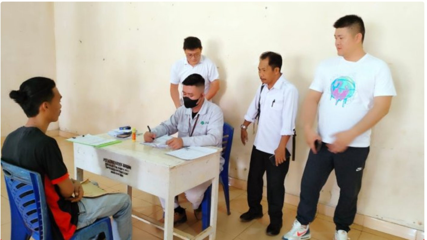
Tampak salah satu calon tenaga kerja PT GNI sedang proses rekrutmen di Desa Towara

TOWARA, Morut Sulteng- PT Gunbuster Nickel Industry (GNI) kembali menggelar Job Fair atau perekrutan secara langsung tenaga kerja lokal di Desa Towara, Kecamatan Petasia Timur, Kabupaten Morowali Utara, Propinsi Sulawesi Tengah, Kamis (23/03/2023).