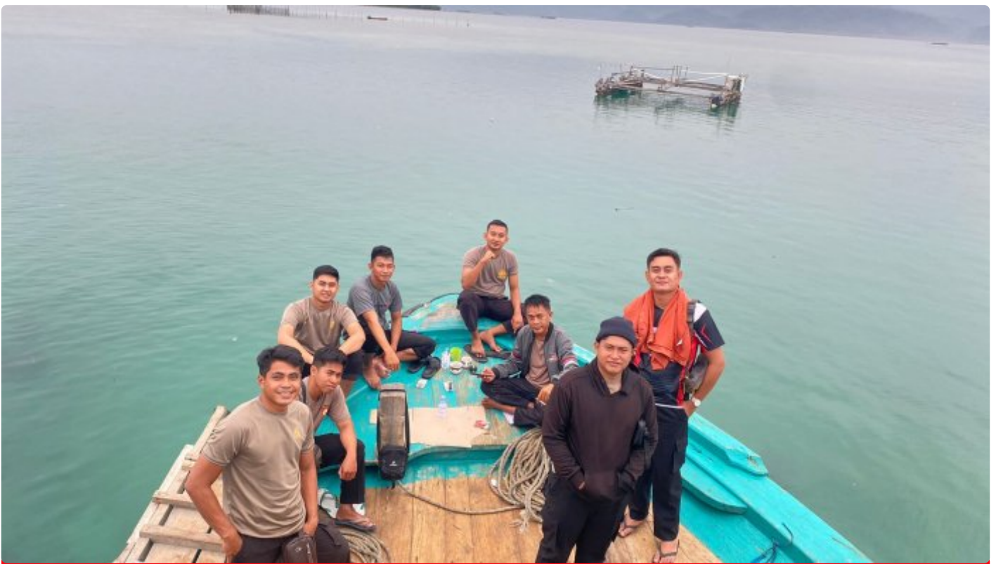
Tampak personil Polres Morowali di atas kapal kawal logistik Pemilu 2024

MOROWALI, Sulawesi Tengah- Sebanyak 37 personel Polres Morowali melakukan pengawalan logistik Pemilu 2024 menuju Kecamatan Bungku Selatan dan Kecamatan Menui Kepulauan, Kabupaten Morowali, Sulawesi Tengah (Sulteng), Jumat 9 Februari 2024 malam.